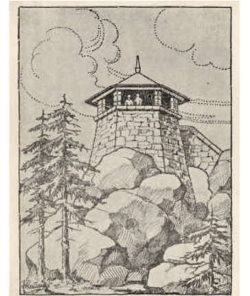
Aussichtsturm auf der Kösseine.

beitswochen, die zusammen 3.770 Mark Lohn erhielten. Am Sonntag, den 12. Oktober 1924, fand die Einweihungsfeier des neuen, 6,43 m hohen Aussichtsturms, geschmückt mit Girlanden durch die Wirtsleute Greger des Kösseinehauses, statt. Die Spitze des Turmes wurde durch die bayerische Fahne geziert. Im Jahr 2012 wurde der Kösseineturm renoviert, da die Mörtelfugen zwischen den Granitsteinen im Laufe der Jahrzehnte bröckelig wurden und starke Schäden durch eindringendes Regenwasser bzw. Frost im Winter verhindert werden sollten. Der Aussichtsturm steht wie vor 100 Jahren auch heute noch thronend auf dem Gipfel der Kösseine und bietet einen herrlichen Blick über unser schönes Fichtelgebirge.